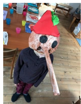
Fertige Pinocchio Larve ☺