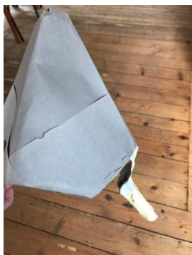
Die Nase am Hut befestigt Für freie Sicht ☺