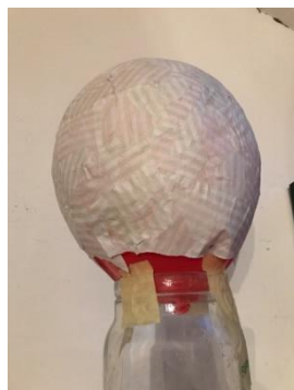
Papier in Schichten über den Ballon gekleistert ☺